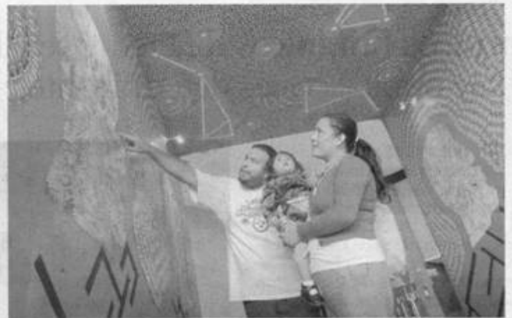
RECORRIDO IMAGINARIO "Viviendo el futuro" en Buenavista

Recurren artistas al reciclaje de 5 mil boletos usados en su inicio