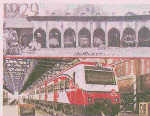
› Una de las gráficas compara la antigua estación Buenavista con la actual.