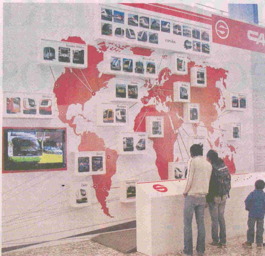
› En la muestra se destacan las ventajas del sistema de transporte.